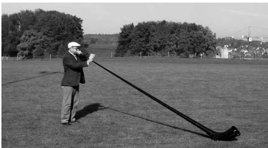
Auch meteorologisch und musikalisch... ein perfekter Geburtstag für die neue Sektion